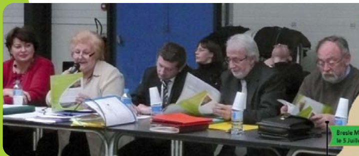
Interventions dans les communautés de communes concernées par le projet du PNR